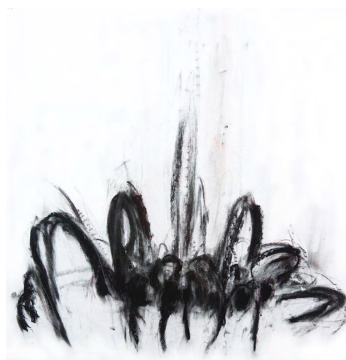
Peur, crayon et pastel sur papier, 1994 © Mâkhi Xenakis