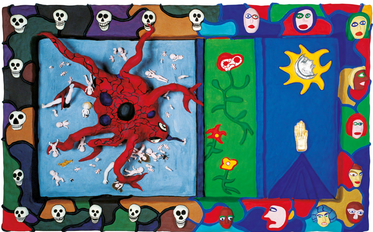
La Peste, Niki de Saint Phalle, 1986

Cette exposition 'artistico-scientifique' est conçue sous l'œil vigilant des spécialistes du Museum national d'Histoire naturelle de Paris.