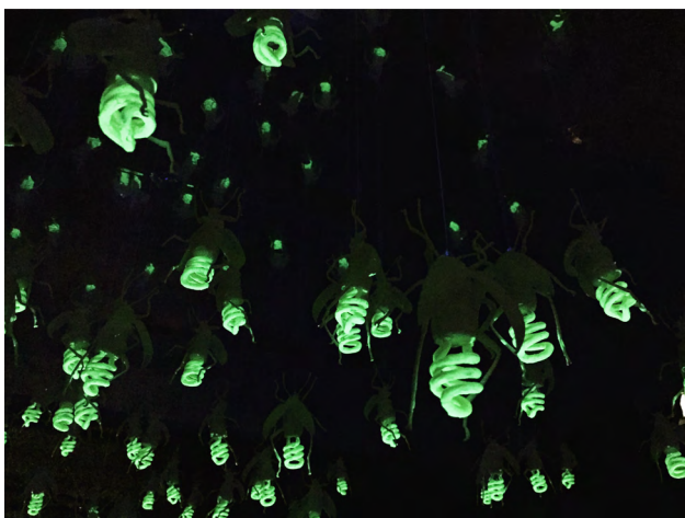
Fireflies, Danysz Gallery, Paris 2017 © Ludo

Il sait faire rêver en redonnant vie aux animaux morts ou disparus et, également, en créant des êtres étranges et imaginaires qui, pourquoi pas, auraient pu exister si l'évolution en avait décidé autrement.