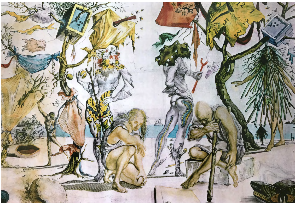
Femme papillon, Salvador Dalí