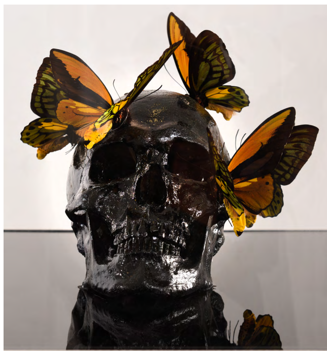
Vanité de Philippe Pasqua, 2010